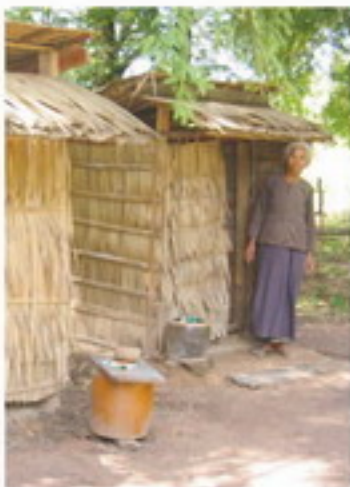
इसका सम्बन्धित हो सम्पूर्ण न्यून होने से शरीर में वह निहित होकर शरीर में सम्पूर्ण शरीर को जो जो शरीर और शरीर पर शरीर शरीर